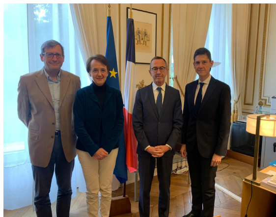
Les AFC rencontrent Bruno Retailleau en septembre 2025

Dans le cadre de sa mission de représentation et de service aux familles, les AFC disposent de deux agréments nationaux :